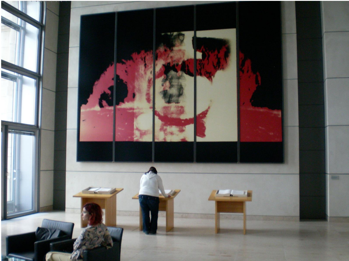
Reichstagsgebäude, Lobby: Rauminstallation von Katharina Sieverding. Fotogemälde „Zerstörung und Wiedergeburt“ und die Gedenkbücher für die von den Faschisten verfolgten (links und rechts) und ermordeten (Mitte) Abgeordneten.