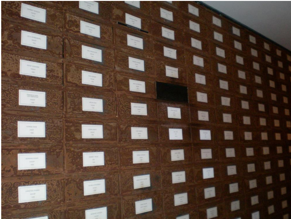
Christian Boltanski (Frankreich): „Archiv der deutschen Abgeordneten“ Hier sind alle demokratisch gewählten Reichstagsabgeordneten ab 1919 mit einem „Postfach“ vertreten. Die schwarze Box steht für die Jahre der faschistischen Diktatur 1933 bis 1945