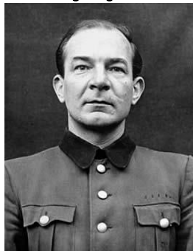
Als Angeklagter 1946